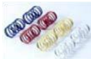
[50519], [53440] Sprężyny