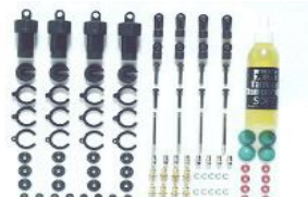
[53619] Mini -CVA