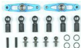
[54058] Aluminiowe stery