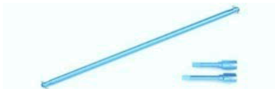
[54026] Wałek aluminiowy