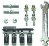
[53662] Regulowane drążki