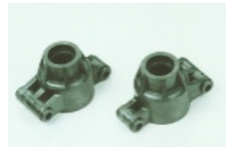
[53673] Tylne zwrotnice 2'