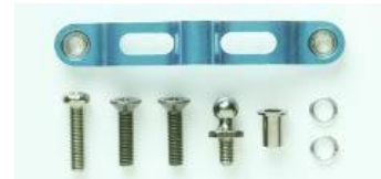
[53864] Aluminiowy mostek