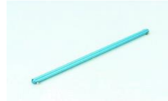
[53620] Wałek aluminiowy