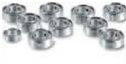
Łożyska Tamiya lub Carson